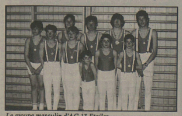
Le groupe masculin d'AG 13 Etoiles.