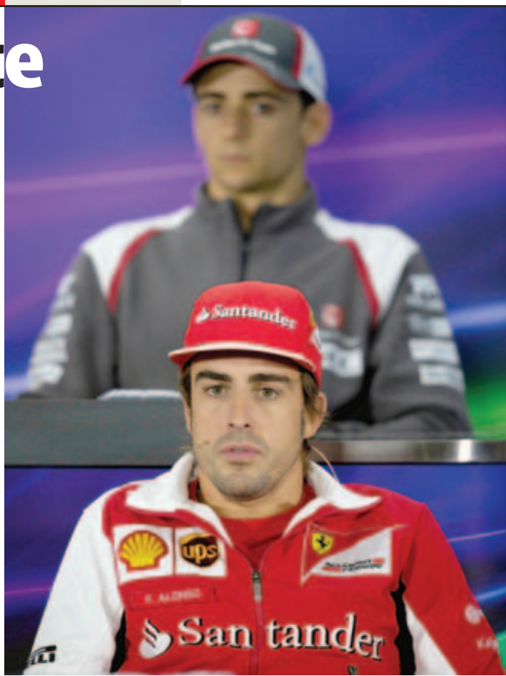
Fernando Alonso commente la semaine chez Ferrari.

Fernando Alonso (Ferrari) parle du départ de Stefano Domenicali de son écurie.