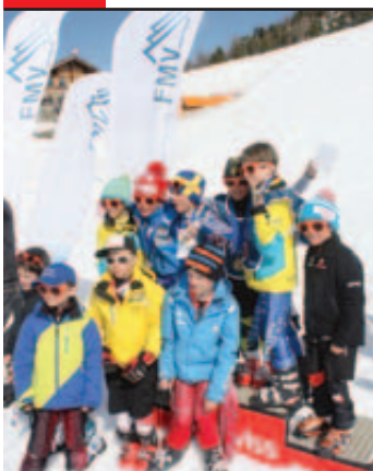
Les cadets sur le podium.