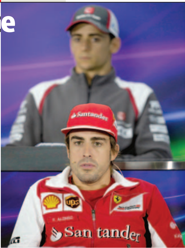
Fernando Alonso commente la semaine chez Ferrari.

Fernando Alonso (Ferrari) parle du départ de Stefano Domenicali de son écurie.